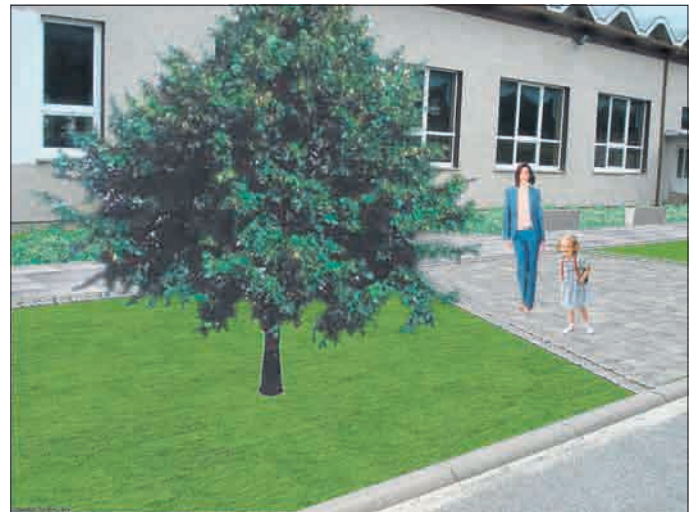
Andreas Henning Bürgermeister der Gemeinde Südeichsfeld